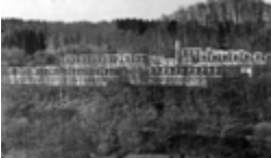
Atelier 5: «Siedlung Halen», 1961 (Fotografie: Albert Winkler)