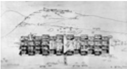
Le Corbusier: «Roq et Rob», 1949 (Ansicht erste Studie von «Roq»)