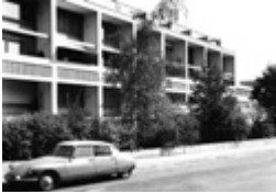
Mehrfamilienhaus Seftigenstrasse, Bern 13 Maisonette-Wohnungen. (Projekt: 1955, Fertigstellung 1959).