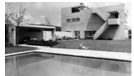
Haus Steinmann, Aarburg AG (Projekt: 1957, Fertigstellung 1959).

«Auch die leisen Dinge bewegen die Welt» Ernst G. Göhner, 1900 - 1971 Gründer der E. Göhner Stiftung E.G.