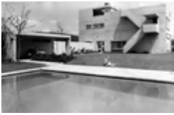
Haus Steinmann, Aarburg AG (Projekt: 1957, Fertigstellung 1959).