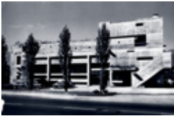
Boilerrabrik Müller, Thun (Projekt: 1956, Fertigstellung: 1959)