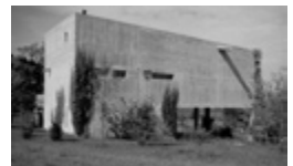
Haus Alder, Rothrist AG (Projekt: 1957, Fertigstellung 1958)