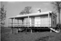
Haus Dorta, Zofingen AG (Projekt: 1959, Fertigstellung: 1960)