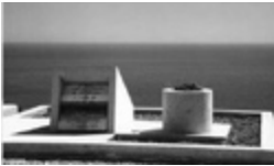
Grabstein von Le Corbusier Roquebrune-Cap-Martin