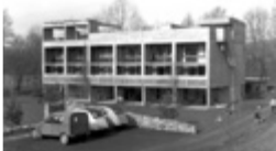
Flamatt 1 (Projekt: 1957, Fertigstellung: 1958)