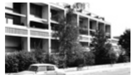
Mehrfamilienhaus Seftigenstrasse, Bern 13 Maisonette-Wohnungen. (Projekt: 1955, Fertigstellung 1959).