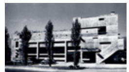
Boilermaker Müller, Thun (Projekt: 1956, Fertigstellung: 1959)