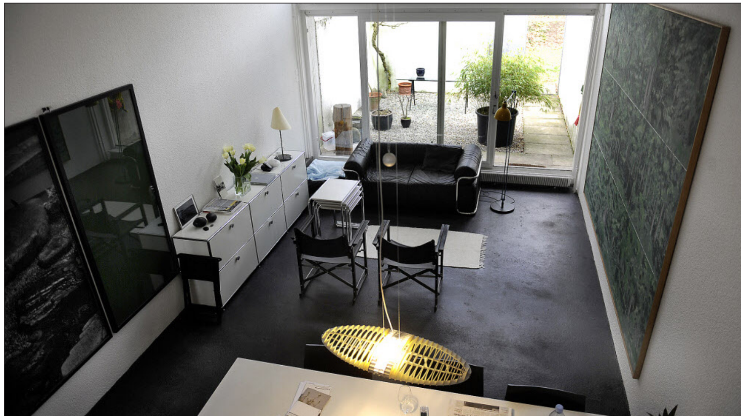
Wohnzimmer. Die Räume sind verhältnismässig klein. Dank raffiniertem Schnitt wirken sie trotzdem grosszügig.

Die Denkmalpflege will heute nicht bloss die Aussenansicht,