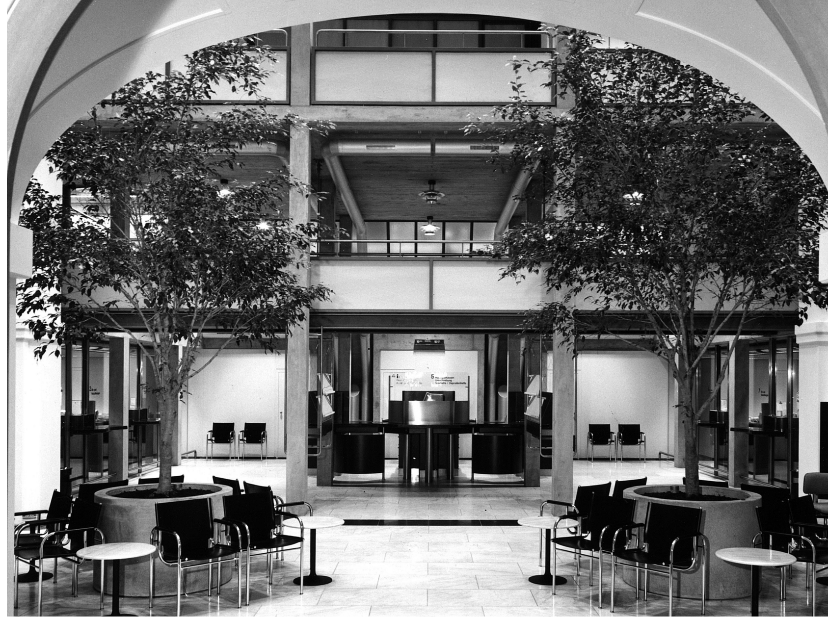
oben: Blick vom Altbau durch den über- dachten Innenhof zum Neubau