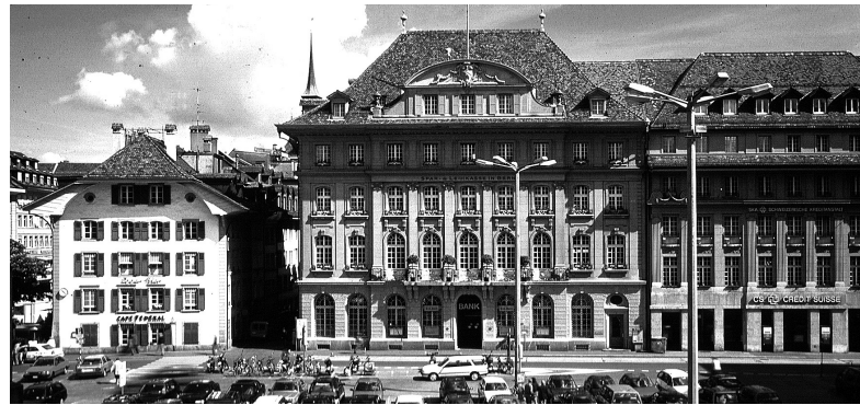
oben: das Gebäude der Spar- und Leihkasse am Bundesplatz in Bern

In seiner Modularität leitet sich der Neubau vom Bestehenden ab, ohne freilich die Formensprache der vergangener Zeiten zu übernehmen. Konsequenterweise modern ist die Gestaltung jener Elemente, die aus dem neuen in den alten Teil übergreifen: das Glasoberlicht über der Halle, der Zwischenboden, der in einem Teil des Altbaus zusätzlich Fläche schafft, die Einrichtung, die Schalter und die Möblierung. Überall wird bewusst gezeigt, was alt ist und was neu.