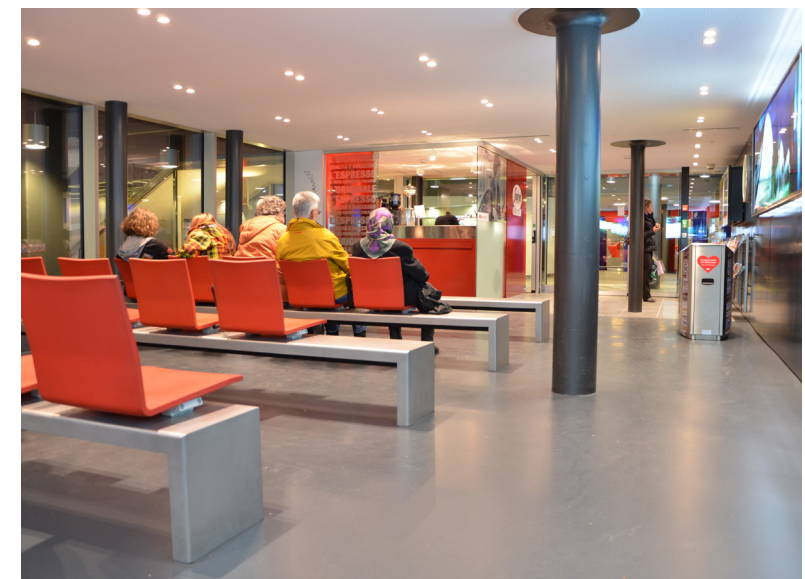
rechts: Wartesaal mit integriertem Café