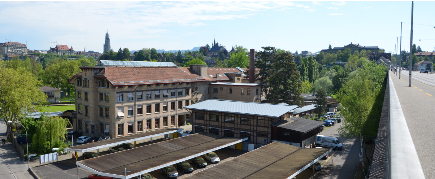
unten: die Ryff- Fabrik von der Monbijoubücke