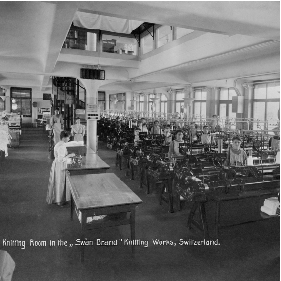
links : historische Aufnahme der Strickwarenfabrik Wiesmann & Ryff